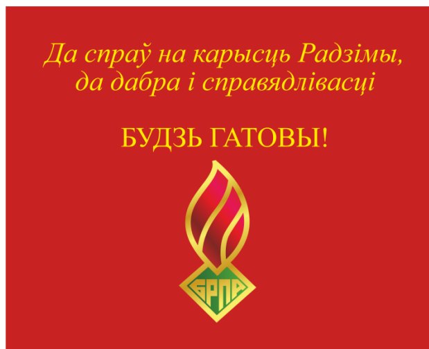
Знамя ОО «БРПО» (оборотная сторона)