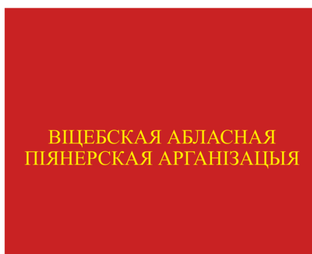
Знамя областной (Минской городской) пионерской организации (оборотная сторона)