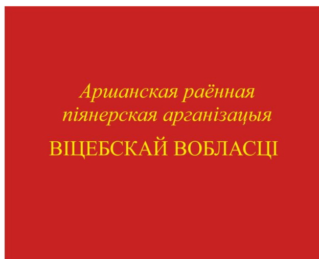
Знамя районной (городской) пионерской организации (оборотная сторона)