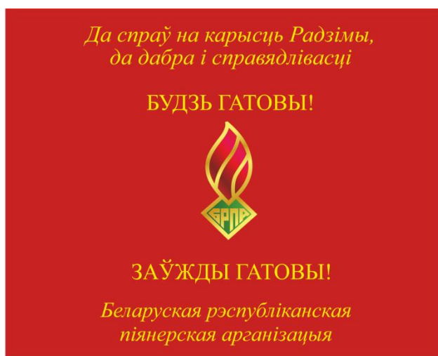
Знамя областной (Минской городской) пионерской организации (лицевая сторона)