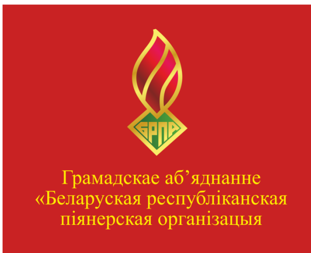
Знамя ОО «БРПО» (лицевая сторона)